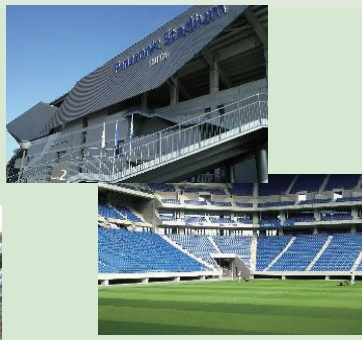
行政視察 (市立吹田サッカースタジアム)