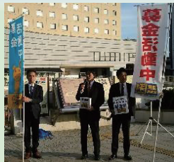
「台風被災者支援募金」駅頭活動