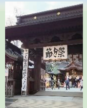
水戸八幡宮節分祭