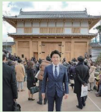
水戸城大手門完成式典