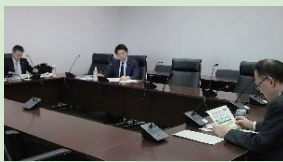
行政視察 (久留米市)